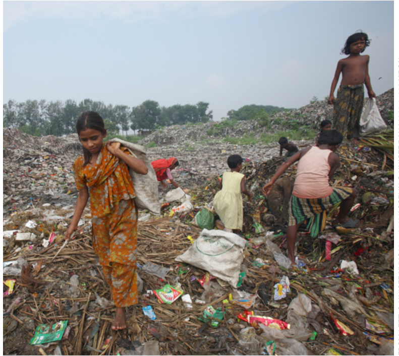
FROM LEFT